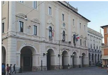
Rieti Nel mirino di "futuReate" la classe politica locale