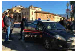
Terremoto, un anno fa la grande paura: case danneggiate e panico in città e provincia | LA SCOSSA DEL 30 OTTOBRE 2016