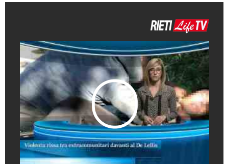
VIDEO – 7 giorni in 100 secondi | 28 ottobre 2017