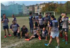
Rugby, la Nsr Frasso Sabino vince a Bologna