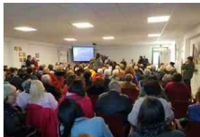
Stati Generali Lilt: a Rieti da tutto il Lazio